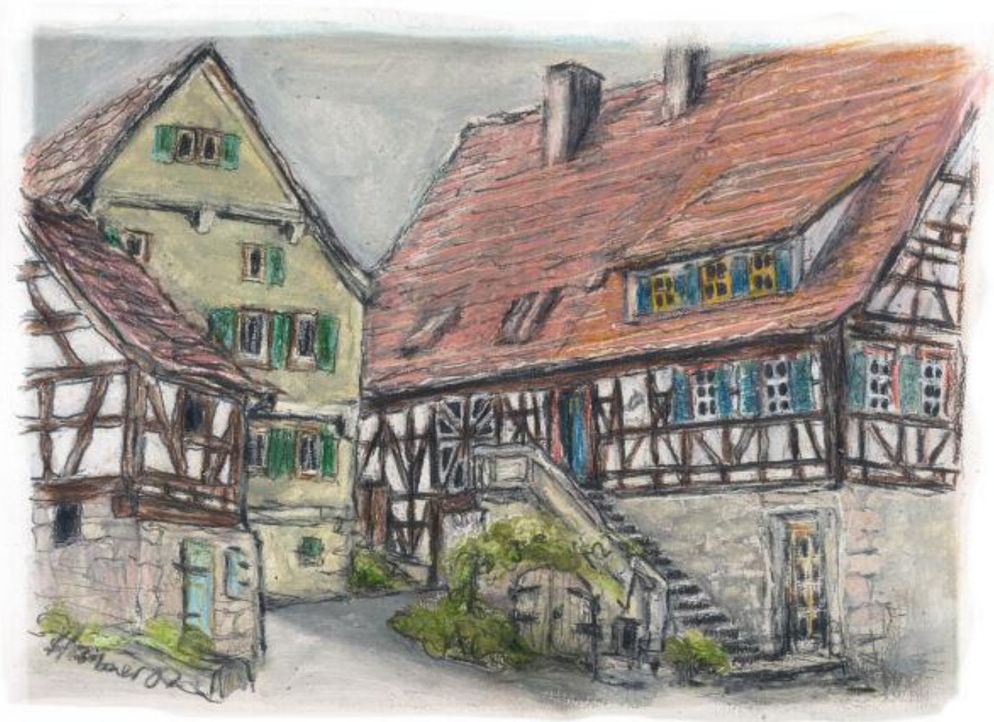
Mit003 Neckartenzlingerstr. 11