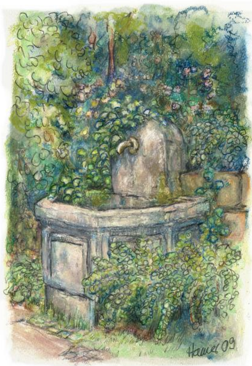
Mit007 Brunnen bei der Kirche