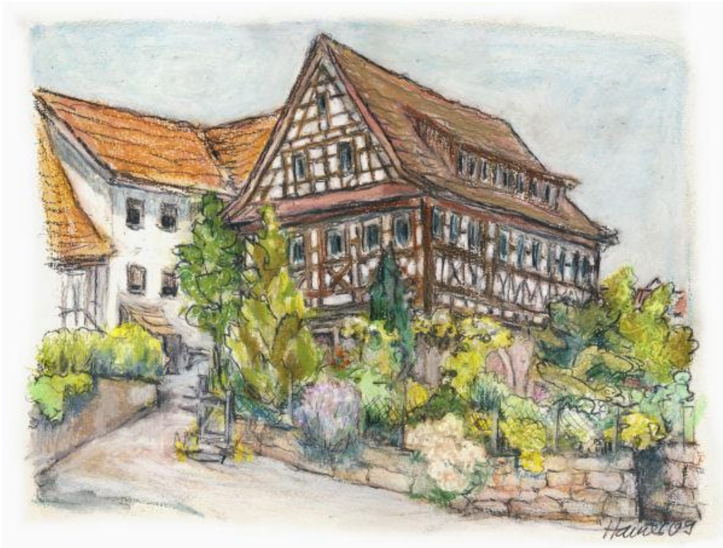
Mit005 Badbrunnenstraße 10